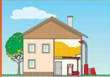
Hackgutheizung 15 - 150 kW (300 kW)