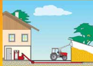
Schneckenlängen bis 15 m