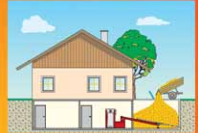
Lagerraum bis 6 x 6 m